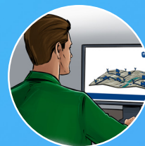
Přehledná webová i mobilní aplikace