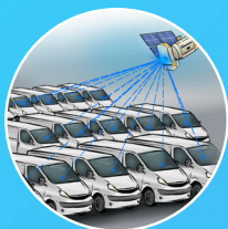
Monitoring vozového parku v reálném čase